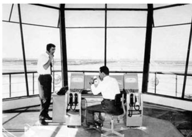
O interior da Torre de Controlo

Seguiram-se as cerimónias da inauguração do Aeroporto, Terminada a Sessão, foi descerrada uma lápide alusiva ao acontecimento ao que se seguiu um almoço volante, que decorreu no piso superior das instalações.