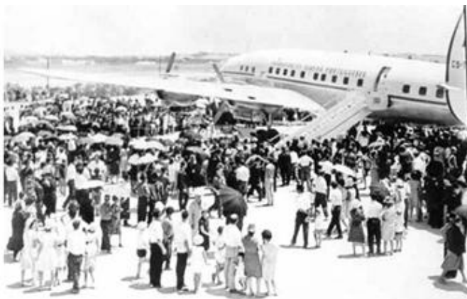
O avião Super Constellation da TAP, rodeado pela multidão

Aguardavam-no no aeroporto os membros do Governo e outras entidades e o Batalhão do Centro de Instrução de Sargentos Milicianos (de Tavira), com bandeira e fanfarra, que fez a Guarda de Honra ao Presidente da República e que, depois de executado o Hino Nacional, passou revista à formatura, ao que se seguiu um desfile em continência perante um palanque onde se acomodaram as individualidades presentes.