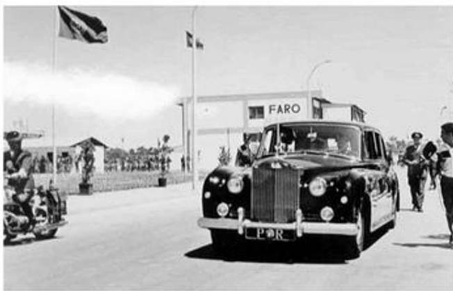
A Chegada do automóvel presidencial ao Aeroporto de Faro

A cerimónia continuou, com uma revista à guarda de honra, composta pelos Soldados da Paz dos Voluntários de Faro, dirigindo-se de seguida para o Edifício da Câmara Municipal, onde descerrou uma lápide marcando a sua passagem por aquele local ao qual se seguiram os discursos que são apanágio nestes actos.