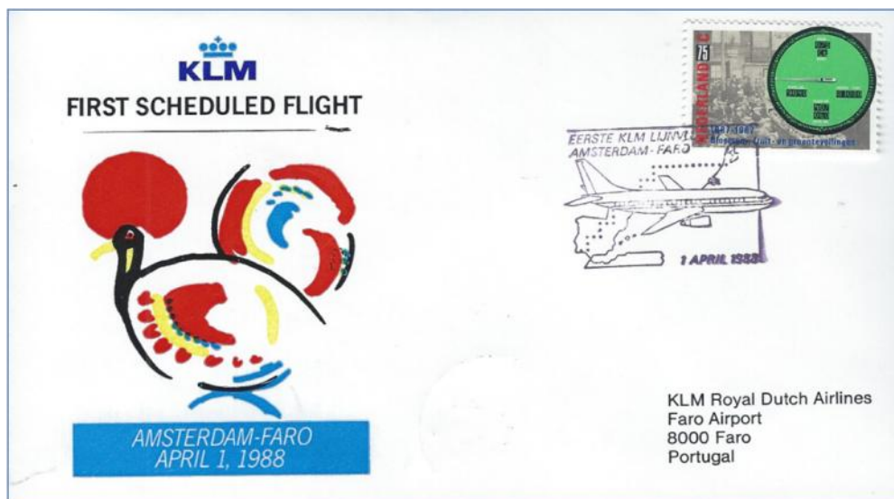
01/04/1988, MAS/FAO / Cor: azul / KLM / 1º Voo (Não referenciado na listagem de voos)