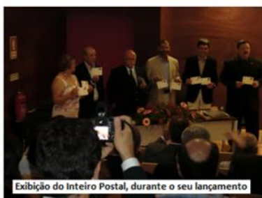
Exibição do Inteiro Postal, durante o seu lançamento