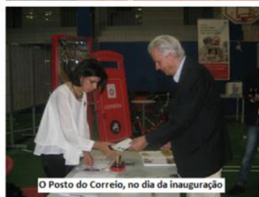
O Posto do Correio, no dia da inauguração