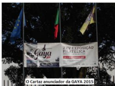
O Cartaz anunciador da GAYA 2015