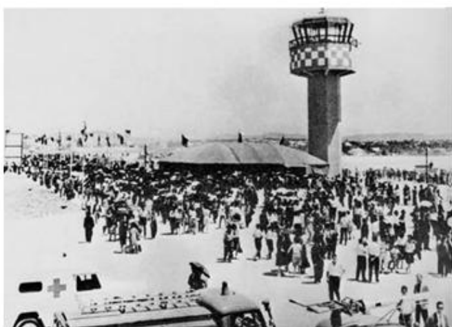
Nem o calor afastou as milhares de pessoas que quiseram marcar presença no dia da inauguração, aqui junto à Torre de Controlo

Cerca das 12H30, aterrou na pista, vindo de Lisboa o avião Super-Constteliom da TAP, "Infante D. Henrique" que transportou 84 convidados, aterrando de seguida várias avio-netas, de diversos aeroclubes do país, que quiseram também abrilhantar esta cerimónia. Depois da recepção e cumprimentos aos convidados, seguiram para a Torre de Controlo de Tráfego, onde o Bispo do Algarve procedeu à bênção das instalações, proferindo na altura "o Algarve sonhou largos anos com este melhoramento e, ultimamente viu nele o meio de se erguer ao nível de zona de turismo internacional. Hoje viu essa alegria e espera, confiada-mente, que ela se há-de traduzir na realidade futura sonhada nos últimos tempos" .