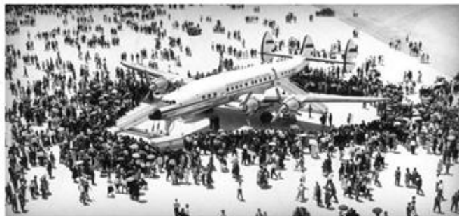
O avião Suoer Constellation da TAP, "infante D. Henrique", rodeado de uma multidão que invadiu a pista

Cerca das 12H30, aterrou na pista, vindo de Lisboa o avião Super-Constteliom da TAP, "Infante D. Henrique" que transportou 84 convidados, aterrando de seguida várias avio-netas, de diversos aeroclubes do país, que quiseram também abrilhantar esta cerimónia. Depois da recepção e cumprimentos aos convidados, seguiram para a Torre de Controlo de Tráfego, onde o Bispo do Algarve procedeu à bênção das instalações, proferindo na altura "o Algarve sonhou largos anos com este melhoramento e, ultimamente viu nele o meio de se erguer ao nível de zona de turismo internacional. Hoje viu essa alegria e espera, confiada-mente, que ela se há-de traduzir na realidade futura sonhada nos últimos tempos" .