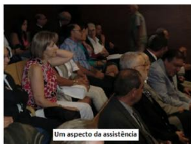
Um aspecto da assistência