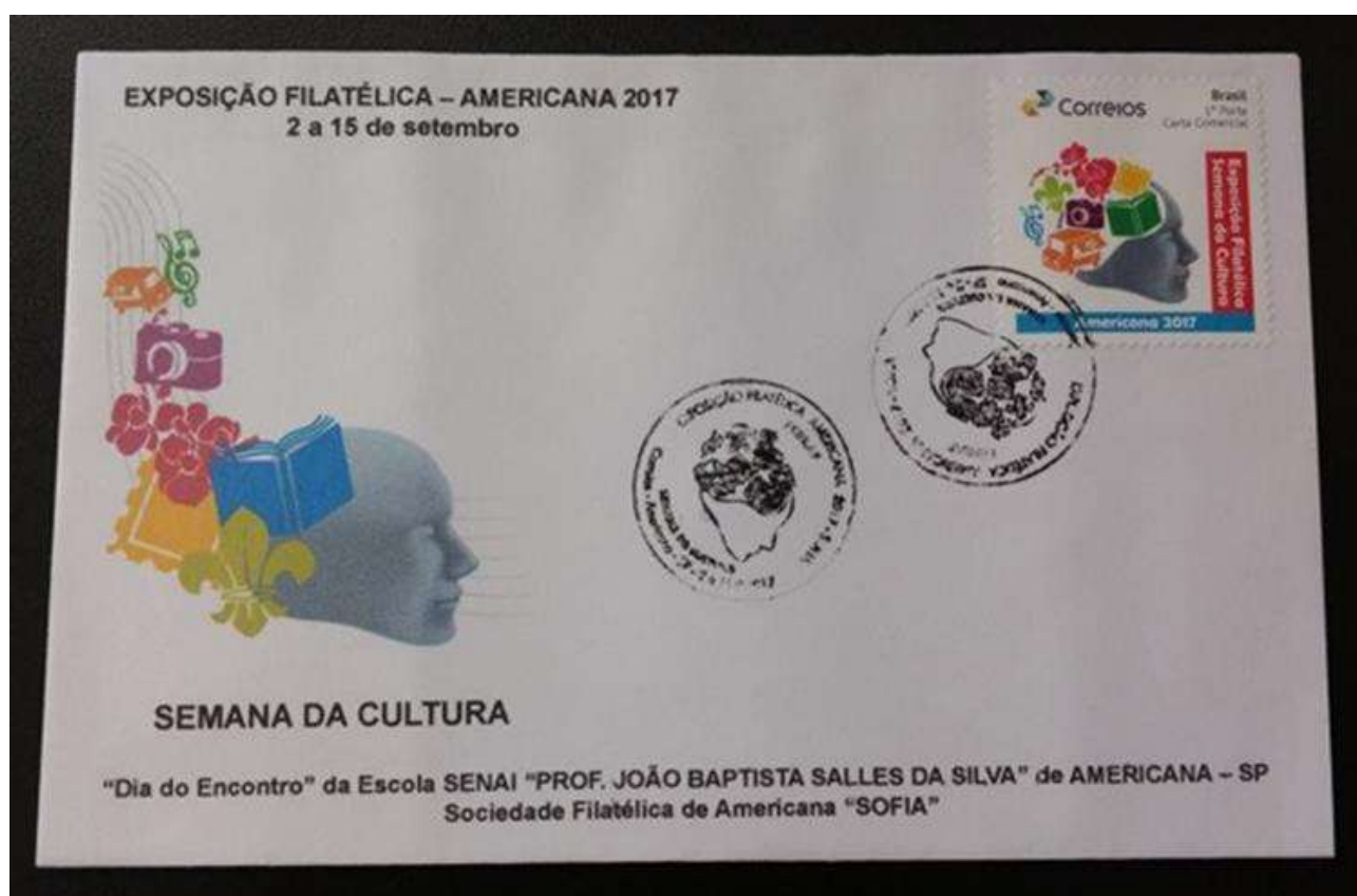
Modelo do envelope obliterado com o carimbo postal comemorativo e selo personalizado