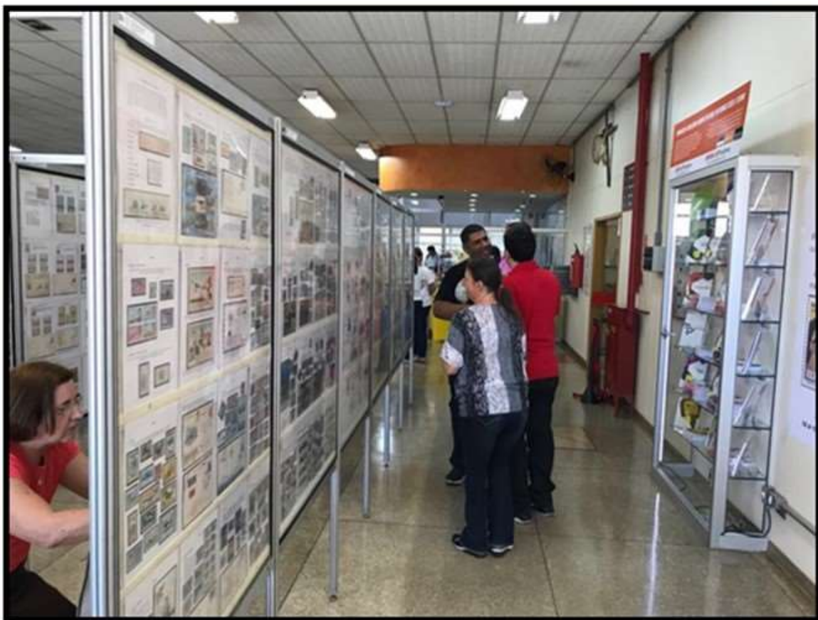
Convidados apreciando as coleções filatélicas expostas nos painéis