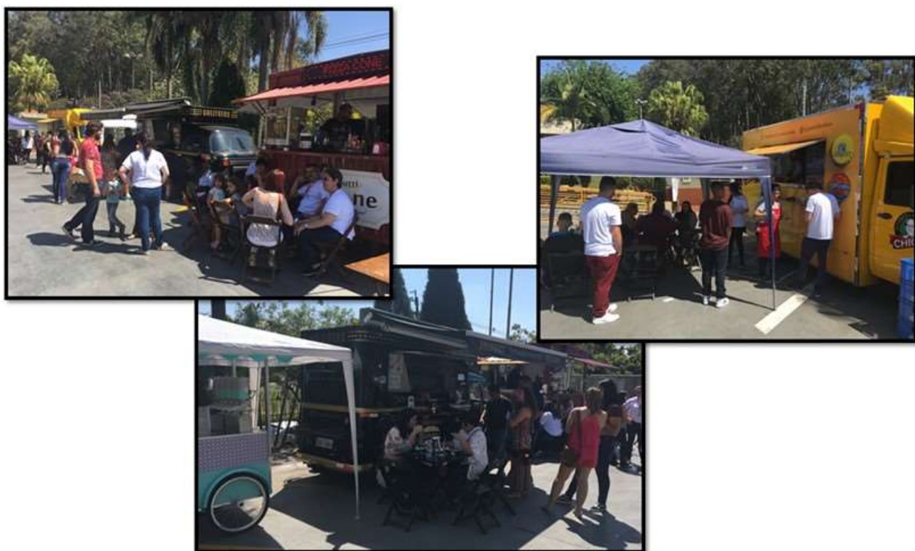
Food Truck's nas instalações da escola SENAI de Americana, participando do evento