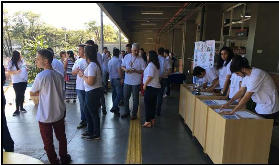
Visita monitorada às instalações da escola