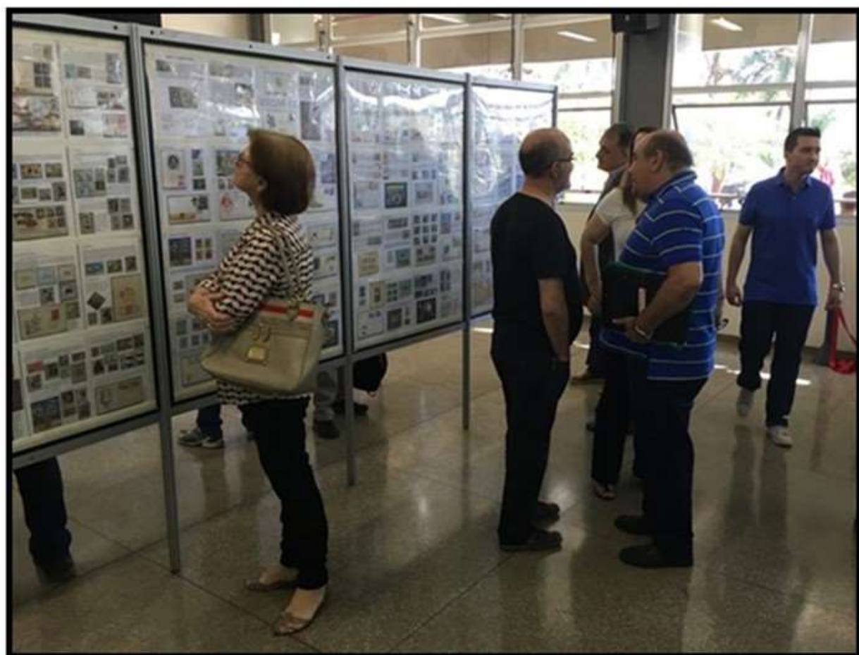
Público presente no evento apreciando as coleções filatélicas nos painéis