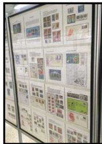
Luiz Carlos Pires de Camargo - Piracicaba – SP (22) . NATAL