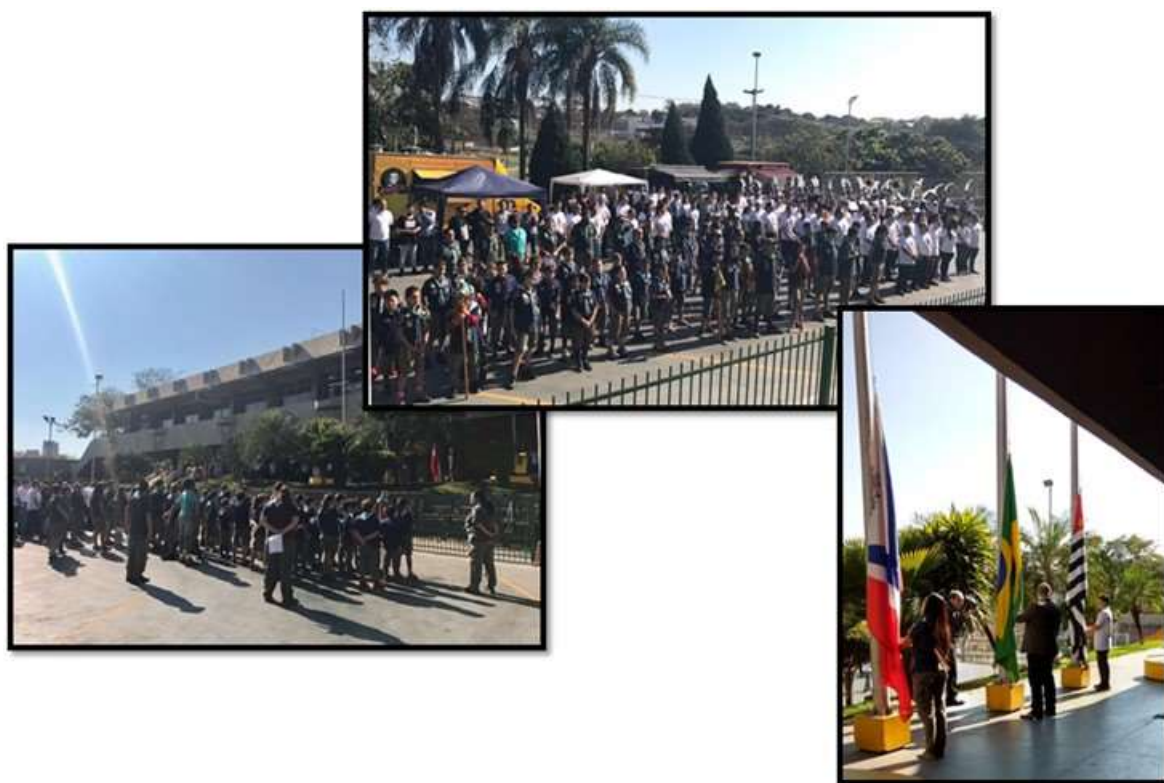
Hasteamento das bandeiras com o Hino Nacional brasileiro, tocado pela Banda Marcial da escola SENAI “Prof. João Baptista Salles da Silva” de Americana