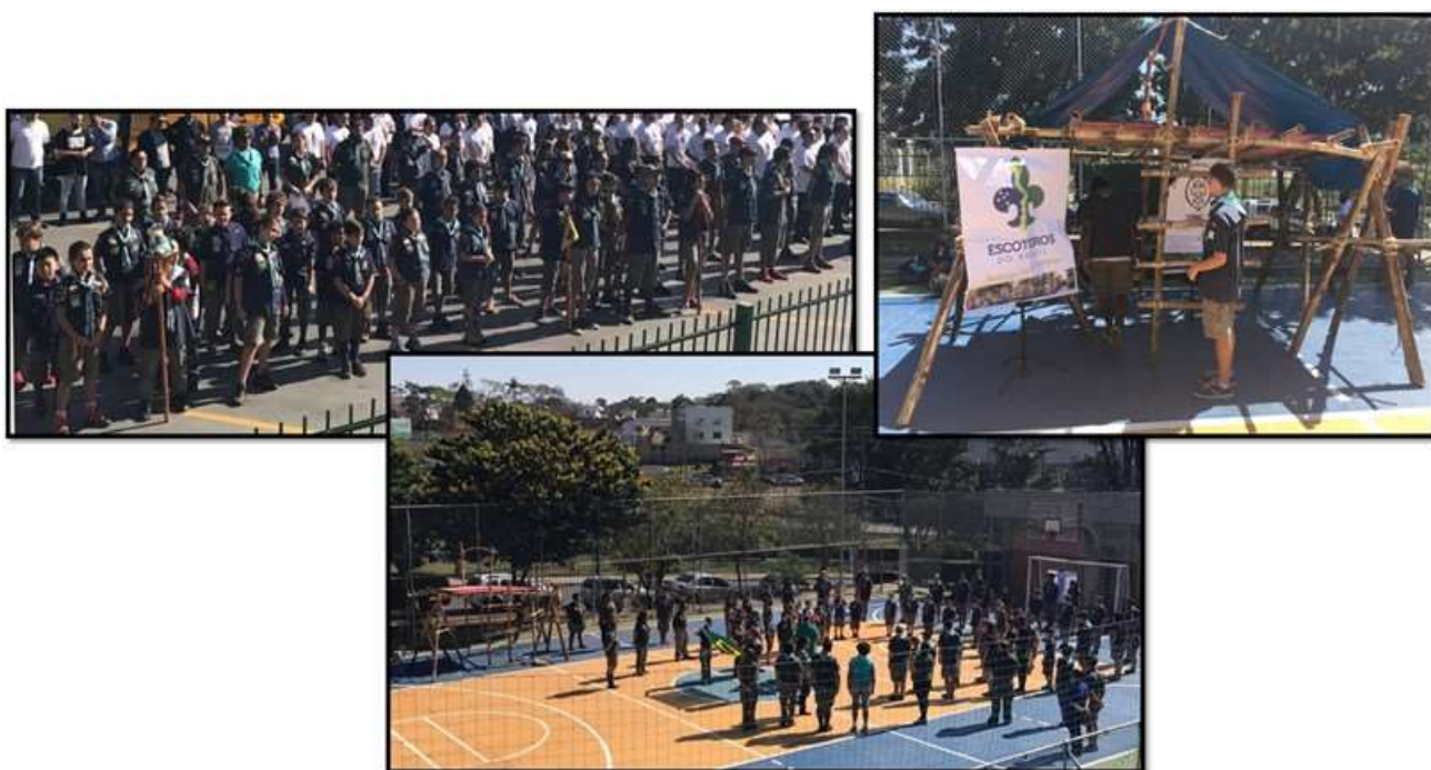
Grupo de Escoteiros do 23º. Distrito Abaeté, desenvolvendo algumas de suas atividades na abertura do DIA DO ENCONTRO, nas instalações da escola SENAI de Americana