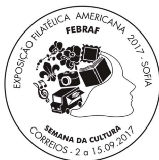
Modelo do carimbo postal comemorativo

O CARIMBO POSTAL comemorativo apresenta, no centro, a imagem de uma CABEÇA DE UM SER HUMANO , na qual em sua parte superior se encontra vários objetos como selo postal, máquina fotográfica, livro, partitura musical, flor de lis, orquídea e um food truck, representando os mais variados tipos de nossa cultura. Na área circular superior os dizeres “FEBRAF” , sigla da Federação Brasileira de Filatelia e na área circular inferior os dizeres “SEMANA DA CULTURA” . Na área circular das bordas do carimbo, na parte superior, lê-se a inscrição “EXPOSIÇÃO FILATÉLICA AMERICANA 2017 - SOFIA” , e na parte inferior “CORREIOS – 02 À 15/09/2017” , datas alusivas ao período de utilização do carimbo na agência dos Correios desta cidade. Ele estampará com a marca desejada as correspondências confiadas àquela unidade.