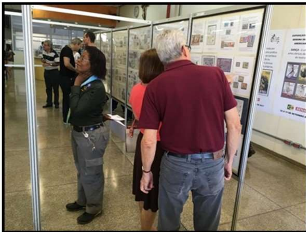
Filatelistas, escoteiros, alunos e amigos prestigiando o evento