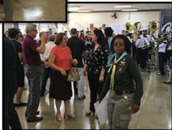
Filatelistas, escoteiros, autoridades, convidados, alunos, ex-alunos, funcionários e visitantes prestigiando a Banda Marcial da escola SENAI de Americana, no salão social