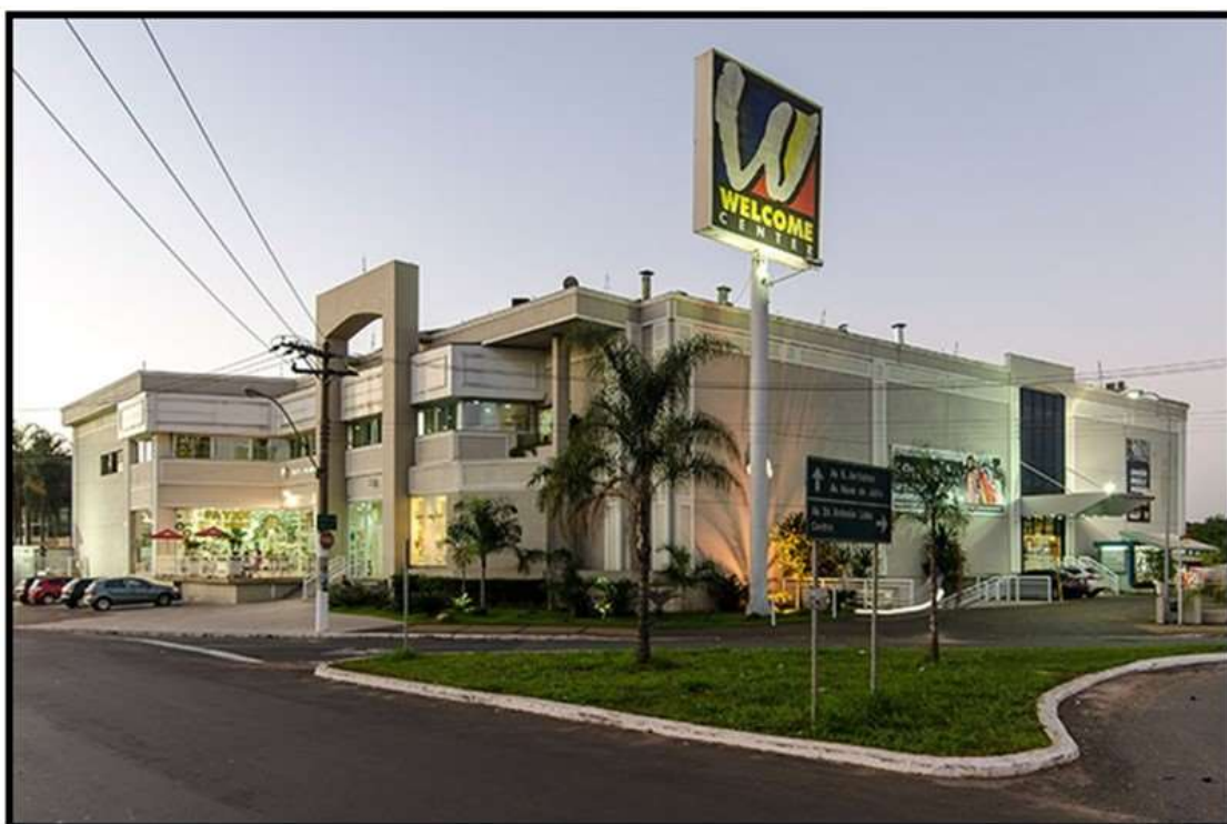
Vista externa do Welcome Center em Americana – SP