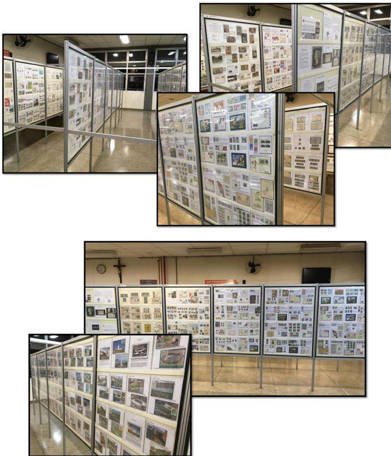
Detalhes das coleções nos painéis da Exposição Filatélica Americana 2017.

Ao todo, a exposição deste ano pode contar com 33 expositores e 35 coleções filatélicas, sendo que 14 destas coleções são de filatelistas juvenis da Sociedade Filatélica de Americana - SOFIA e Sociedade Philatélica Paulista - SPP - Mackenzie Tamboré de São Paulo, e mais 3 coleções numismáticas. Foram 6 cidades participantes: Americana, Carapicuíba, Itu, Piracicaba, São José do Rio Preto, São Paulo, todas do Estado de São Paulo.