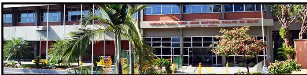
Escola SENAI "Prof. João Baptista Salles da Silva" – Americana – SP

No dia 02 de setembro de 2017, às 10:00 horas a Sociedade Filatélica de Americana "SOFIA" , promoveu o lançamento do carimbo postal comemorativo, a apresentação do selo personalizado e a abertura da EXPOSIÇÃO FILATÉLICA - AMERICANA 2017 , em comemoração à "SEMANA DA CULTURA" e em homenagem ao "DIA DO ENCONTRO" da escola SENAI "Prof. João Baptista Salles da Silva" . O evento ocorreu na sede da escola SENAI, na Av. Brasil Sul, 2801 – Parque Residencial Nardini, Americana - SP e contou com o apoio e a participação de autoridades da Federação Internacional de Filatelia – FIP, Federação Brasileira de Filatelia – FEBRAF, Sociedade Philatélica Paulista – SPP, Paper-Up!, Correios, Banda Marcial da escola e do Grupo de Escoteiros do 23º. Distrito Abaeté.