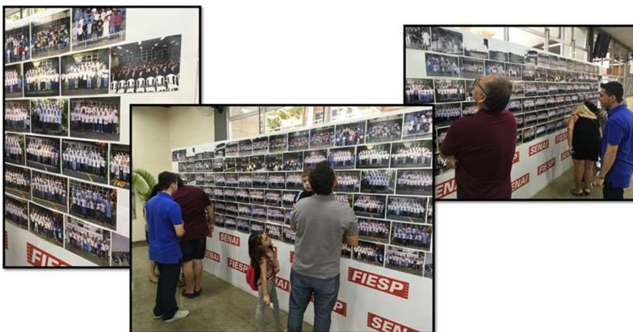
Exposição de Fotos de ex-alunos e ex-funcionários do SENAI de Americana