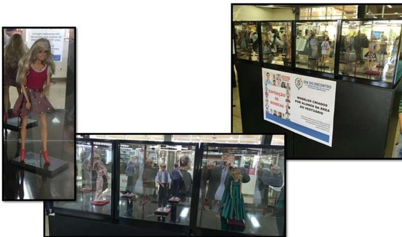
Exposição de Bonecas – modelos criados por alunos da área de vestuário da escola SENAI de Americana