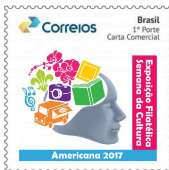
Modelo do selo personalizado

O SELO PERSONALIZADO é uma peça filatélica produzida pelos Correios com a qual as pessoas interessadas, físicas ou jurídicas, têm a oportunidade de personalizar suas correspondências, tornando-as um veículo difusor de suas imagens, mensagens e marcas representativas. O selo personalizado apresenta na parte superior, a logomarca dos CORREIOS e traz os dizeres BRASIL – 1º. PORTE – CARTA COMERCIAL . Do lado direito, a peça traz a inscrição “EXPOSIÇÃO FILATÉLICA SEMANA DA CULTURA” , e na parte inferior “AMERICANA 2017” . Seguida ao centro de uma imagem de uma CABEÇA DE UM SER HUMANO , representando os mais variados tipos de cultura, como por exemplo: o SELO POSTAL – destinado a comprovar o pagamento da prestação de um serviço postal, sendo também material de colecionismo e pesquisa de filatelistas, MÁQUINA FOTOGRAFICA – instrumento óptico para captação de imagens na forma de fotografias individuais, LIVRO – produto intelectual e a base da educação, PARTITURA MUSICAL – representação escrita de música padronizada mundialmente, FLOR DE LIS – símbolo oficial do escotismo no mundo todo, ORQUÍDEA – uma das maiores famílias de plantas existentes, e um FOOD TRUCK – espaço móvel que transporta e vende comida.