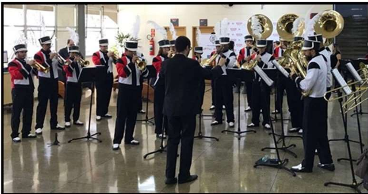
Apresentação da Banda Marcial da escola SENAI “Prof. João Baptista Salles da Silva” de Americana, logo após o descerramento da fita inaugural da Exposição Filatélica Americana 2017