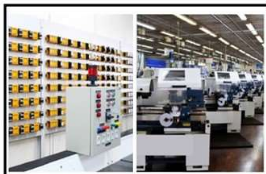
Instalações do SENAI "Prof. João Baptista Salles da Silva de Americana