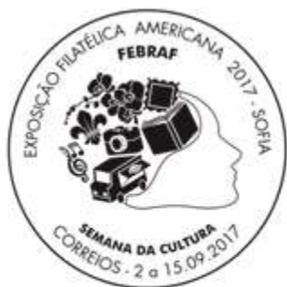
Carimbo Postal Comemorativo