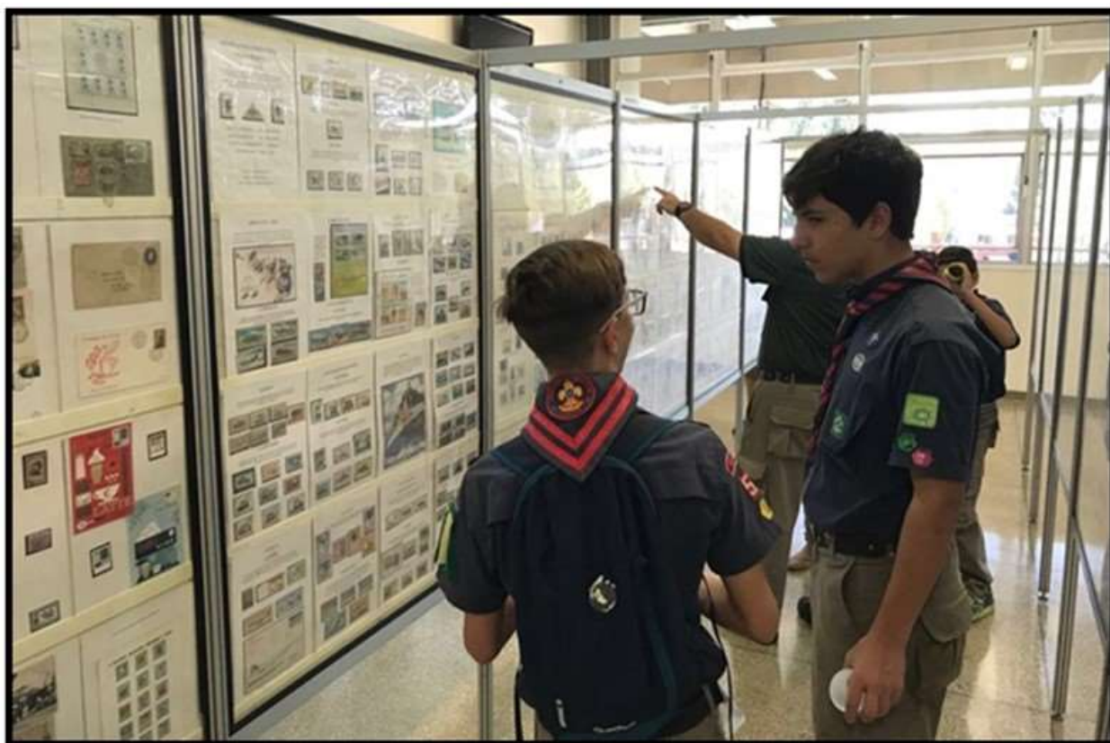
Escoteiros entre os painéis das coleções filatélicas, após a abertura da exposição