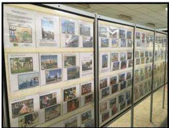
Ítalo João Pagni - Americana – SP (7, 8, 9, 10 e 11) . TURISMO NO BRASIL É O MÁXIMO . MOEDAS DO BRASIL (Vitrine - Numismática)