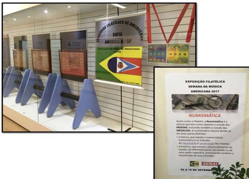
Painéis da Numismática, prontos para a exposição