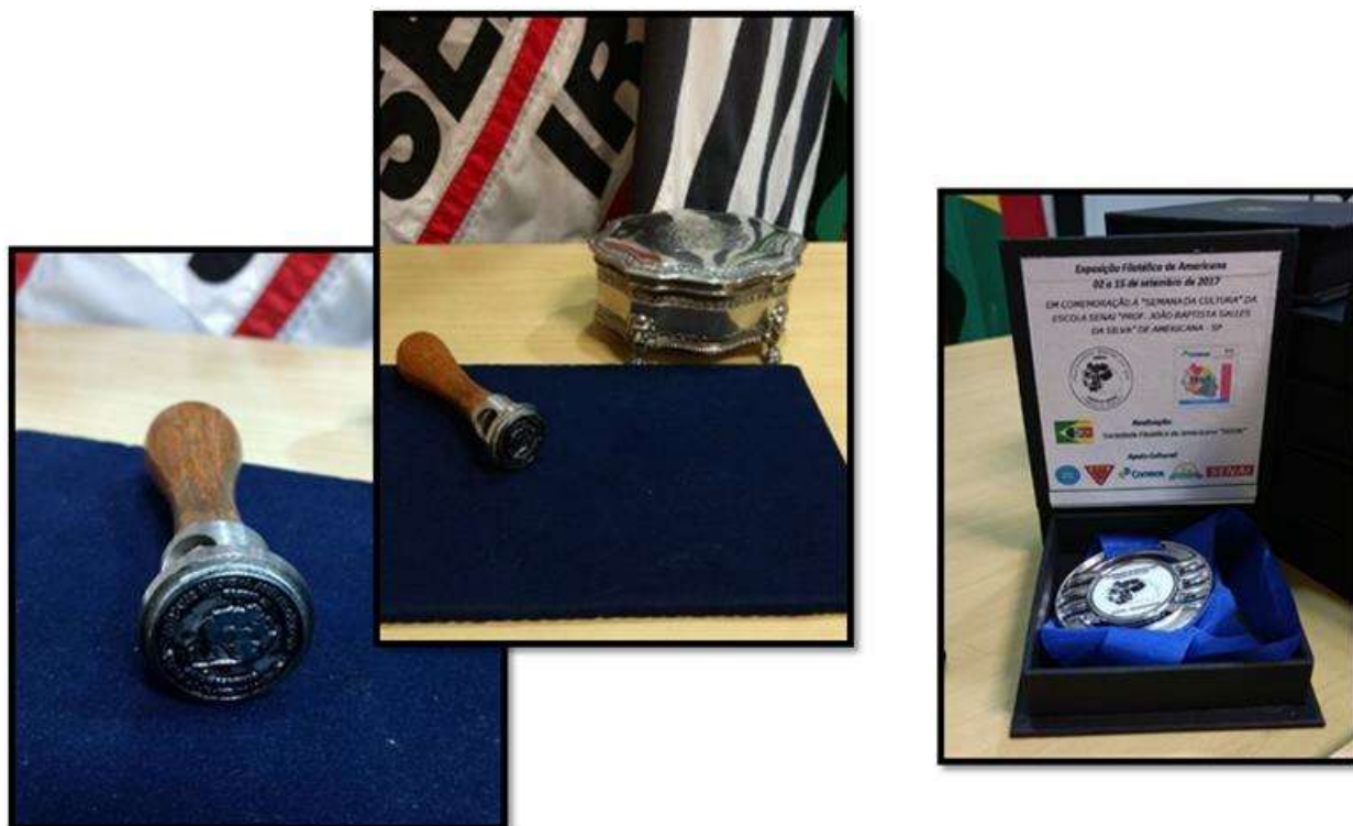
Carimbo postal comemorativo para o ato de obliteração e modelo das medalhas de agradecimento