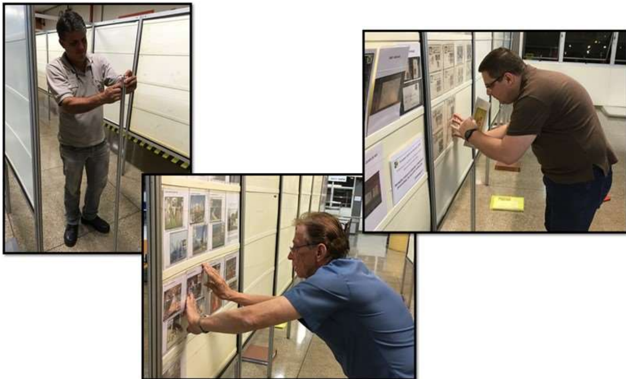
SOFIA e SENAI, parceria até na montagem dos painéis

A montagem dos painéis ocorreu nos dias 29 a 31 de setembro de 2017, contando com o apoio da equipe do SENAI de Americana e da SOFIA.